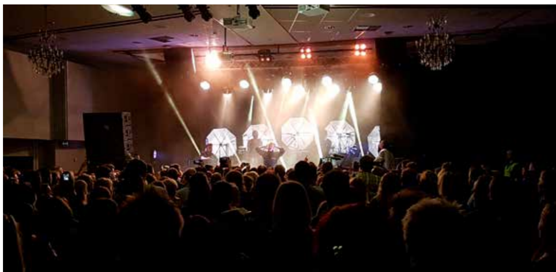
BAKgården LIVE, Highasakite.