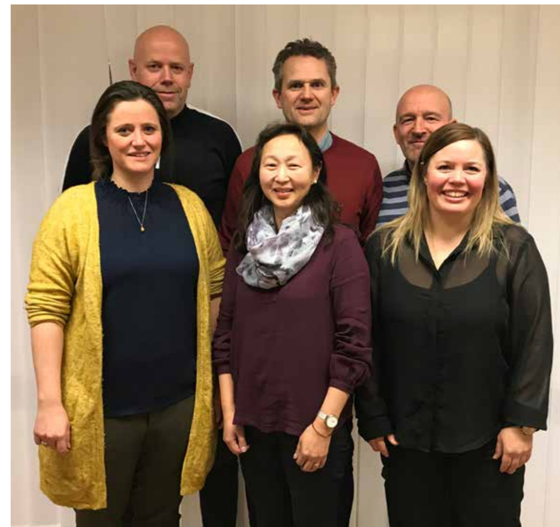
Styret i Harstad profileringspool.

Styret i Harstad profileringspool ønsker oss et mer gjennomtenkt forhold til byutvikling. Vi etterlyser en stor kraftfull visjon som vi alle kan samle oss rundt. Og viktigst av alt: En visjon som leder Harstad til gjennomtenkte og konkrete handlinger. En slik kraftfull visjon har svært mange av byene som har lyktes tatt på alvor. Et godt eksempel på dette er Bodø, som gjestet både et frokostmøte og Harstadkonferansen. Og vi ser jo selv hvor mye positivt som er blitt skapt gjennom Seire ved å dele-filosofien med visjon, verdier og tydelige mål. Vi har stor tro på byen vår. Mye positivt skjer, men den store utfordringen blir å samle alle krefter rundt en felles plan. Vi i Harstad profileringspool er klare til å samarbeide for å løfte byen vår enda noen hakk opp. Det er derfor vi er til!