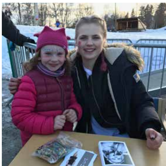
Folk i Parken.

deltakere fikk en innholdsrik ettermiddag i Folkeparken.